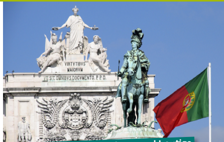
Baixa: Die Downtown Lissabons und heutige Fußgängerzone wurde vom Marquis Pombal im 18. Jahrhundert im Schachbrettmuster angelegt.

► Eléctrico 28: Ein geldbeutelchonendes Erlebnis ist die Fahrt mit der historischen Straßenbahn Nr. 28, bei der man die wichtigsten Sehenswürdigkeiten in Lissabon passiert.